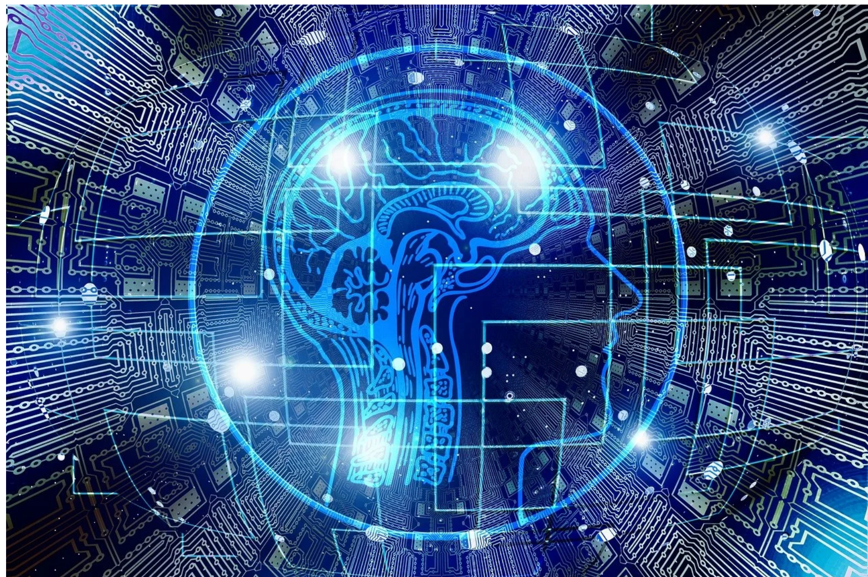
Intelligenza artificiale