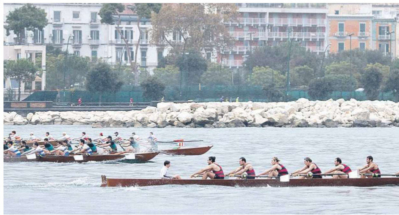
LA REGATA Tutto pronto per dare il via alla Coppa Lysistrata organizzata dal Circolo Italia sul Lungomare

Si gareggia secondo la formula Maisto che esalta l'amalgama e la compattezza di un circolo con le otto yole composte da due atleti senior, due junior, due ragazzi e due master. Difficile parlare di favori perché spesso conta più il cuore del tasso tecnico ma Italia-Posillipo-Savoia se la giocano. In gara anche CC Napoli, Monopoli, Bari, Telimar Palermo, Imo, Stabia. È un pezzo di storia nel quale si sono cimentati campioni olimpici, del mondo e d'Europa, gli equipaggi di Oxford, Cambridge, e delle più prestigiose università internazionali. La gara si disputerà alle 11,30; ben visibile dal lungomare, sarà preceduta da altre 8 regate per l'assegnazione di numerose "challenge" perpetue quali la coppa Romolo Galli per la categoria Juniores in quattro Yole; la coppa Pattison per la categoria Ragazzi in quattro Yole;