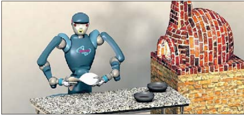
PROTOTIPO 2.0 RoDyMan, il robot pizzaiolo che i visitatori di "Futuro Remoto" potranno ammirare nei padiglioni di "Futuro Remoto" in piazza del Plebiscito a Napoli

Prima mondiale a Napoli, RoDyMan sarà lo chef Da domani impasti hi-tech in piazza del Plebiscito