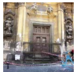
Centro Storico di Napoli, ancora crolli: si sbriciola il cornicione della Chiesa di Santa