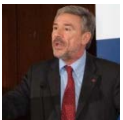
Ass.Panini su crisi del commercio e fitti commerciali