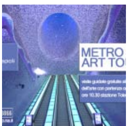
Metro e Bici: la nuova mobilità di Napoli