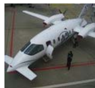
Aerei d'affari made in Pozzuoli Il velivolo hi-tech atterra in Cina