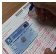
Esenzioni ticket: istruzioni per l'uso