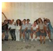
Salicelle, l'altra Scampia dove l'incesto non è peccato