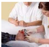
Diabete, scoperta la chiave clinica la malattia nasce da un'infiammazione