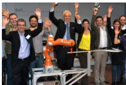
Il team del Prisma Lab – Federico II

Dalla terapia genica per malattie rare al Dna artificiale , dal robot “pizzaiolo” all’analisi dei rapporti tra il mondo iperuranico della finanza e quello reale del lavoro: ricerche disparate eppur animate dallo stesso fuoco, quello dell’eccellenza. Riuniti stamattina a Città della Scienza, presentano i loro progetti ai non addetti ai lavori una pattuglia di circa 150 i ricercatori selezionati dal Consiglio Europeo della Ricerca, la prima organizzazione paneuropea che finanzia la ricerca di frontiera esclusivamente sulla base del valore scientifico dei progetti e dei candidati. Per carità, non che altri finanziamenti avvengano secondo criteri meno trasparenti, solo che in questo caso quel che conta è solo il progetto e la credibilità di chi lo presenta, indipendentemente dall’ente di