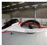
Da Augusta Westland Project zero: primo convertiplano 100% elettrico

Tag: artificiale , futuro , napoli , parte , pizzaiolo , robot Cristian Fuschetto