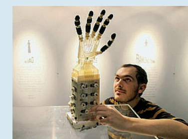
La mano del progetto Dexmart

NAPOLI - E' in gran parte italiana la realizzazione della prima mano robotica antropomorfa a cinque dita capace di afferrare e manipolare oggetti dalla forma strana o delicati, come le uova, senza incidenti, proprio come gli esseri umani. Il progetto si chiama Dexmart ed è stato promosso dalla Federico II di Napoli e dall'Università di Bologna e finanziato dall'Unione europea. «Un grosso problema che la comunità robotica ha lottato per risolvere è quello della manipolazione. Non stiamo parlando di pinze - ha spiegato Bruno Siciliano della Federico II - né dei robot industriali che sono abbastanza bravi a raccogliere le cose e a metterli giù. Ma di strutture capaci di gestire gli elementi proprio come gli esseri umani fanno con le mani, secondo la complessità propria della manipolazione». Il progetto Dexmart ha portato il team a costruire una mano antropomorfa a cinque dita in grado di afferrare uova, girare una carta di credito, togliere una penna dalla mano di una persona o un oggetto e riporlo delicatamente. E' composta da fili intrecciati di un polimero forte e riesce a sollevare un carico di cinque chilogrammi in un secondo facendo uso di piccoli motori elettrici posti nell'avambraccio.