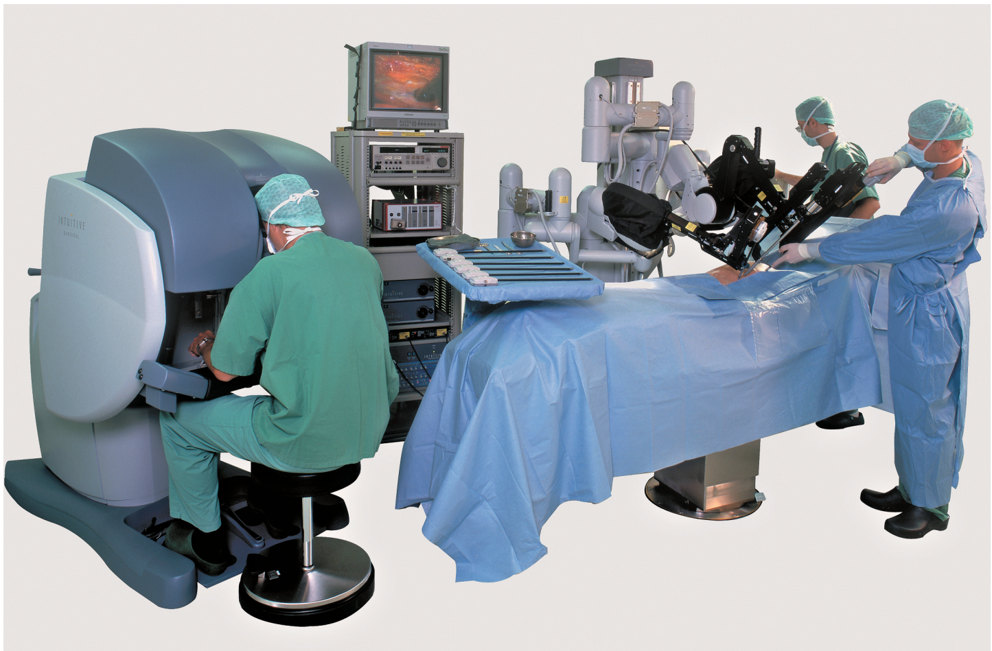
I campi di utilizzazione e applicazione della robotica sono assai numerosi e diversificati.

Ci accorgiamo che un nuovo ritrovato è diventato di uso quotidiano quando nessuno si stupisce più della sua presenza nei nostri ambienti. Al loro esordio nel mondo degli umani, tutte le nuove tecnologie hanno provocato sentimenti forti come terrore, ammirazione, idolatria, o luddismo. Le locomotive, le automobili, i personal computer e i telefoni cellulari hanno impiegato diversi anni prima di diventare familiari a tutti nella vita di ogni giorno. Sembra che la prossima tecnologia candidata a diventare pervasiva nella nostra quotidianità sia quella robotica. Paradossalmente rallentati dalle eccessive attese