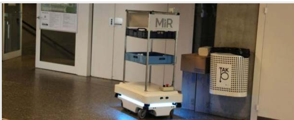
MiR100-robotten er blandt de fire finalister til Dira Automatiseringsprisen 2015: Foto: MiR