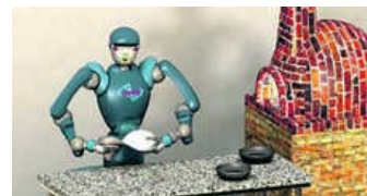
NAPOLI, ECCO IL ROBOT PIZZAIOLO: DA DOMANI A PIAZZA DEL PLEBISCITO