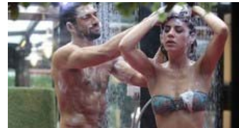
GF14. IL 20ESIMO GIORNO