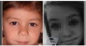
DENISE E LO 'SCHERZO': IL COGNOME DELLA RAGAZZINA NOTO GIÀ NEL 2005