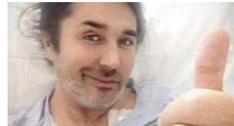
SCIALPI OPERATO AL CUORE, SUO MARITO NON PUÒ ASSISTERLO: "PER LO STATO SONO UNO SCONOSCIUTO"