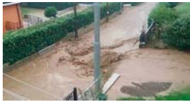
ALLAGAMENTI E SCUOLE CHIUSE IN CAMPANIA. BENEVENTANO IN GINOCCHIO