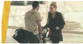
LAURA CHIATTI E BOCCI, BRUSCA LITE PUBBLICA IN AEROPORTO