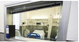
DIETA VEGANA AL BIMBO DI 2 ANNI RICOVERATO IN OSPEDALE È GRAVISSIMO