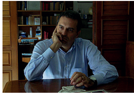
Luigi de Magistris, 46 anni

Diciotto deleghe. Come dire: fa tutto lui. Luigi de Magistris è in assoluto il sindaco italiano che ha più deleghe di tutti, mentre ci sono suoi assessori che di deleghe ne hanno appena una. L'ex pm gestisce la Mobilità, la Polizia Municipale, i fondi Ue e, da poco, anche lo sport. Batte tutti gli altri, se solo si pensa che Pisapia a Milano ha nove deleghe; Marino a Roma ne ha sei; e Fassino a Torino appena tre. Renzi e Orlando a Firenze e Palermo non ne hanno neppure una.