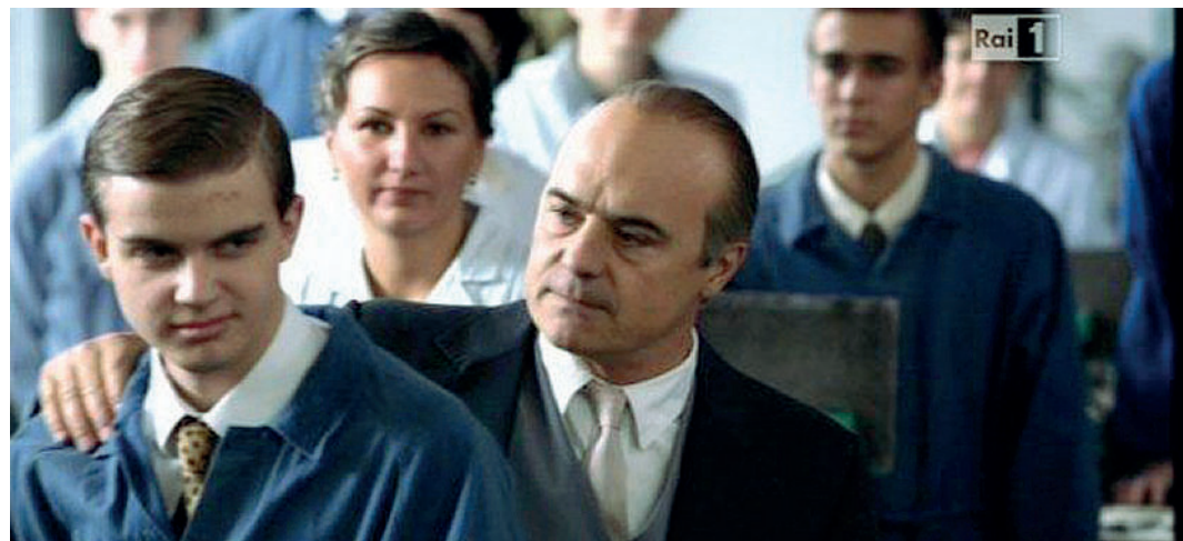
Luca Zingaretti (al centro della foto) nei panni di Adriano Olivetti nel film tv di Rai 1

Nella seconda e ultima puntata del film dedicato all'imprenditore di Ivrea, la nascita della fabbrica flegrea