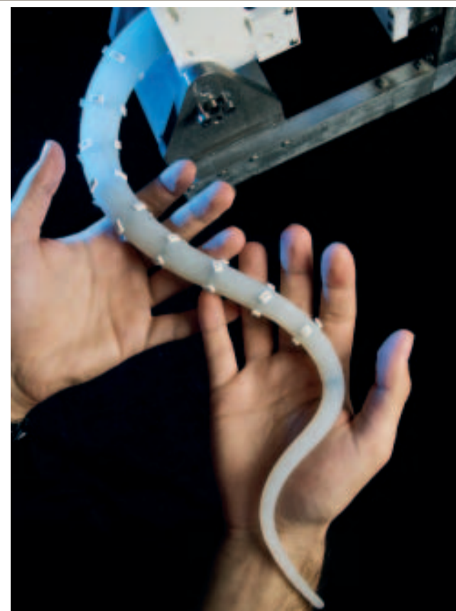
Copia fedele. Un tentacolo di Octopus, il robot-polpo creato a Pisa