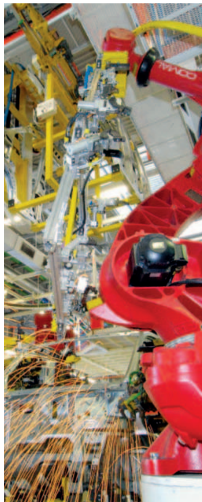
L'AVANGUARDIA INDUSTRIALE TARGATA COMAU